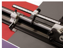
gepatenteerd magneetsysteem système aimanté breveté