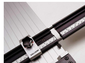
rechter verlenglat rallonge droite