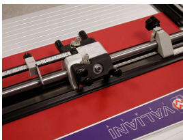
snijkop op stalen kogellagers tête de coupe sur roulements à billes en acier